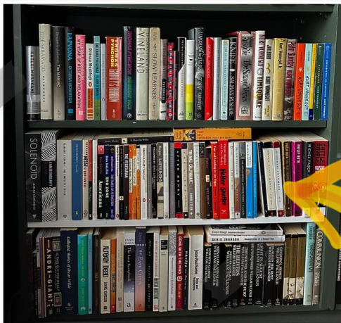
Lista e burimeve

Mbrojtja e fëmijëve në hapësirën online, prioriteti ynë!